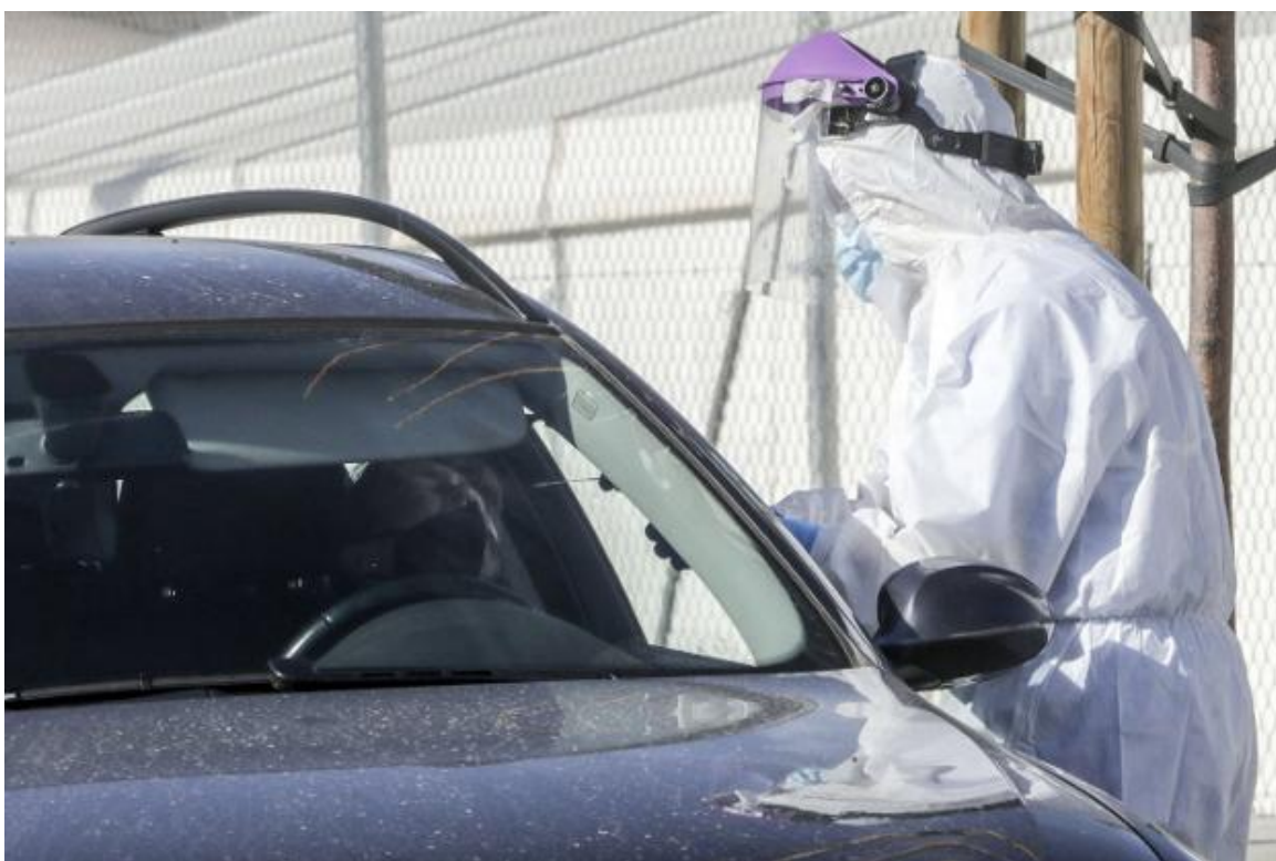
Toma de muestras para una analítica de Covid-19 en el hospital de campaña de La Fe. irene marsilla

Advierten al Consell de la necesidad de vigilar la incidencia de la variante británica y de moderar las restricciones según oscilen los contagios